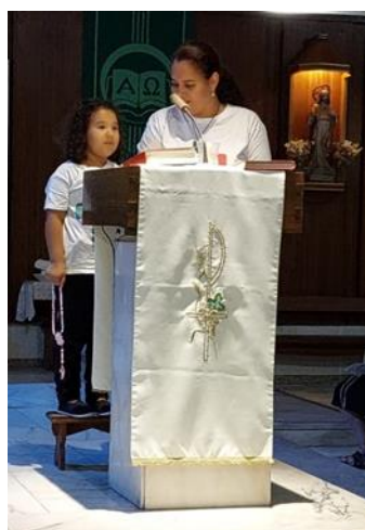
FOTO 1 | Encontro dos padres do Patriarcado com Dom Rui Valério em Turcifal

FOTO 2 | Abertura da Catequese 2023 - 2024